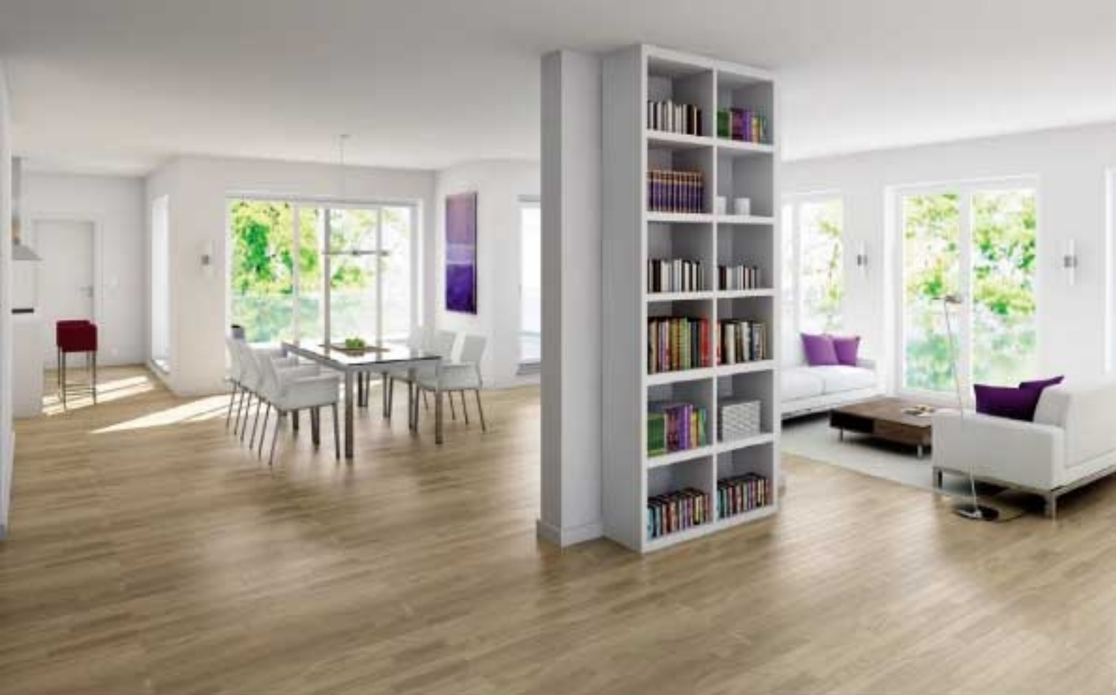
Darstellung Dachterrasse-Wohnung und Erdgeschoss-Wohnung mit Garten- anteil aus der Sicht des Illustrators