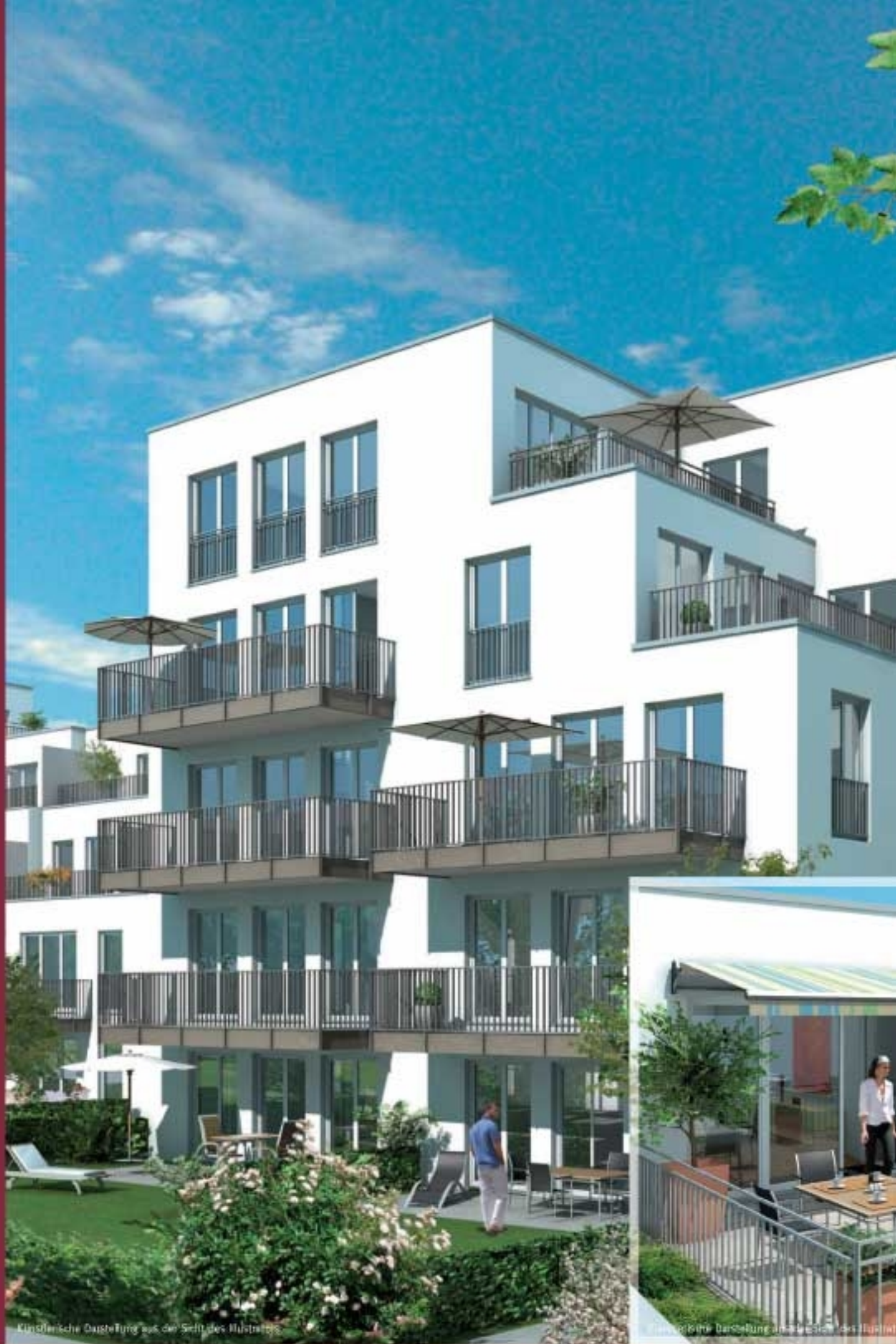
Künstlerische Darstellung aus der Sicht des HauptstraÙe