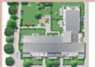
ДОМ 1 ДОМ 2 ДОМ 3 ДОМ 4